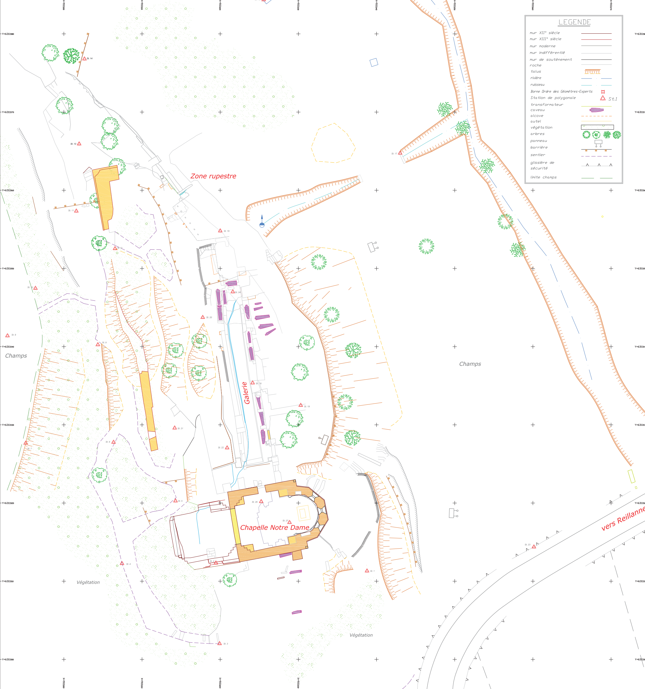
PLAN DE SITUATION Echelle 1/25 000°